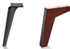
Carmen Brushed Black Chrome drewniana Carmen