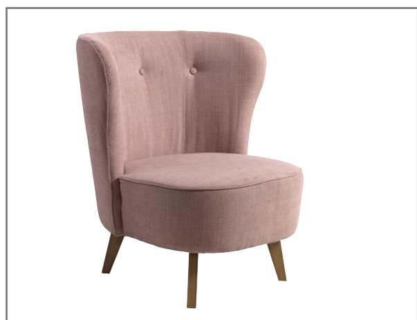
Carmen; wersja podstawowa; nóżki drewnine CARMEN

Fotel typu Carmen, to fotel-kameleon, można by rzec. Wszystko za sprawą tapicerki, która w zależności od barwy i struktury, zgrabnie dostosowuje się do charakteru otoczenia. Kształt fotela z kolei, odznaczający się miękką, łagodną w zagięciach linią, skutecznie zachęci do zatopienia się w nim i odpłynięcia w krainę błogiego relaksu.