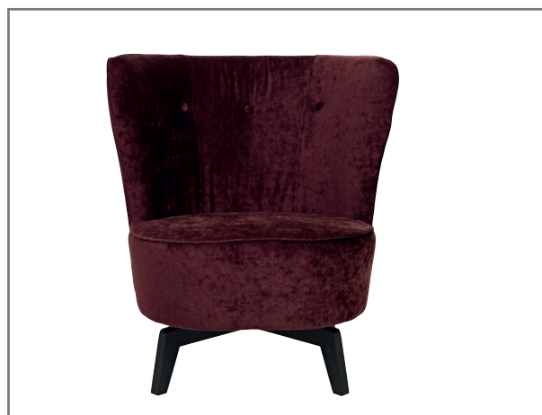
Carmen, wersja obrotowa